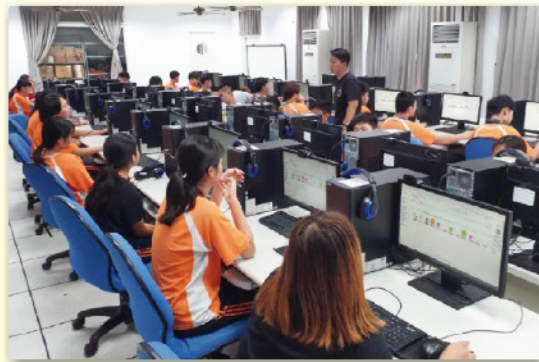
電子資訊資源介紹

介紹本校圖書資訊系統，線上操作，自助借還書機操作。 本校參與高中職夥伴學校電子書聯盟，與大學端合作達成資源共享目的。 推廣數位閱讀，讓學校師生能透過網路善用電子資源，快速吸收知識，了解社會政經脈絡、欣賞人文藝術，並提升生活與專業知能。