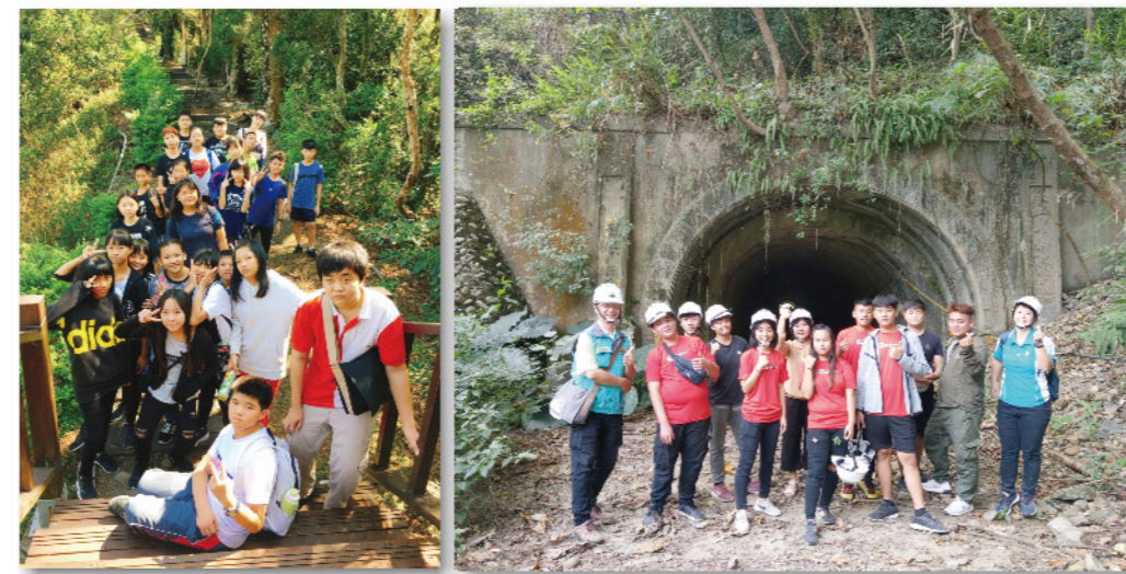
十八羅漢山生態導覽