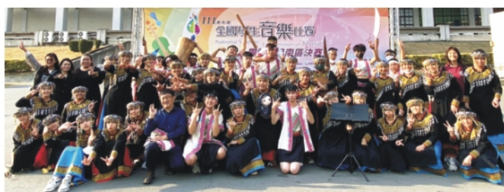
▲全國音樂比賽合影