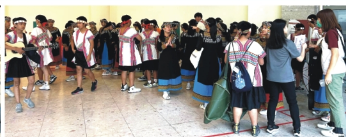
▲畫面中可以看到每一次比賽前學生總是忙中有序的準備