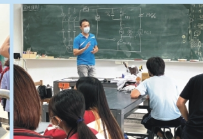
▲自來水工程-配電盤操作