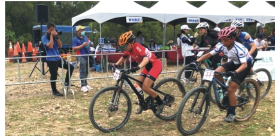
▲越野賽比賽過程充滿張力