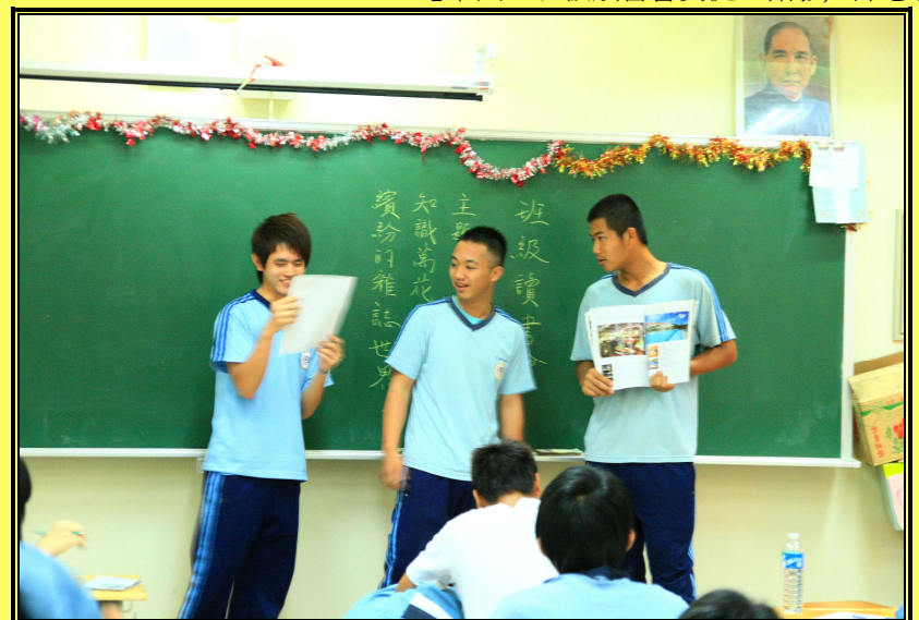
【下圖：班級讀書會實況。】

100 學年度高中優質化「班級讀書會計畫」在本學期實施，高一、高二學生熱烈參與，彼此在課堂上分享讀書心得，激蕩出一圈又一圈的知性漣漪。本次讀書會主題為〈知識萬花筒——繽紛的雜誌世界〉。參加讀書會的同學先進行分組，然後在圖書館期刊雜誌區 80 餘種期刊雜誌中挑選自己組別的讀書題材。有人挑選《世界電影》，有人挑選《國家地理雜誌》，有人挑選《髮型書》，各取所好，呈現多采多姿的繽紛畫面。同學閱讀完雜誌後，便以〈我愛□□雜誌的十大理由〉為題，撰寫一篇讀書心得。在課堂上，每組輪流上台分享，一方面介紹雜誌的內容，另一方面則說出喜愛那本雜誌的十大理由，讓同學更深入的認識那本雜誌的優點。經過分享交流，同學更懂得如何運用學校期刊雜誌的資源，他們發現，原來琳瑯滿目的期刊雜誌世界蘊藏了這麼多的知識、趣味，應該善加利用。