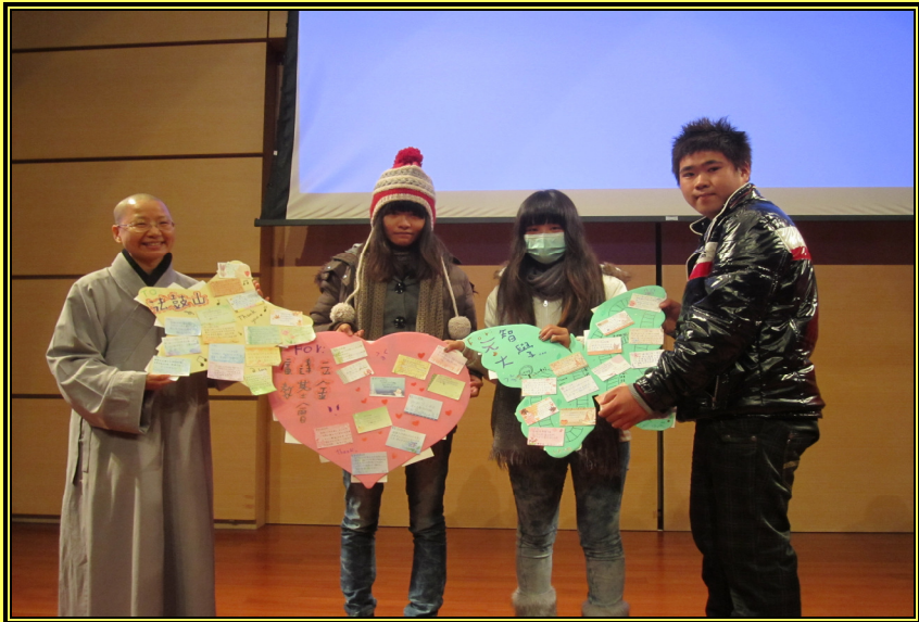
【本刊訊】 【上圖：台北城探索營學生合照。攝影／學務處提供】

法鼓山慈善基金會本於悲天憫人之情懷，近年來持續關懷本校清寒學生，先後做出許多令人感動的善舉。