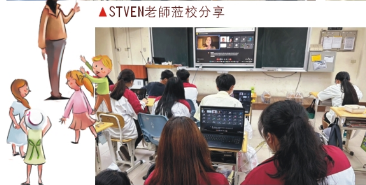
◀與伙伴學校線上交流中