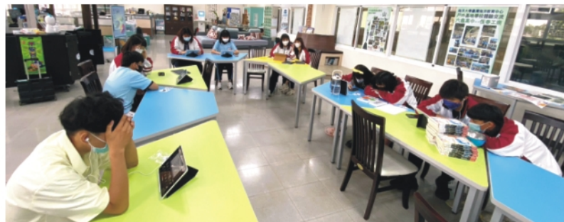
▲為了準備課程，大家都皺起眉頭