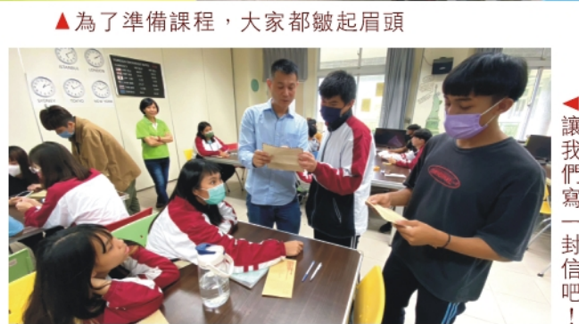
◀讓我們寫一封信吧！