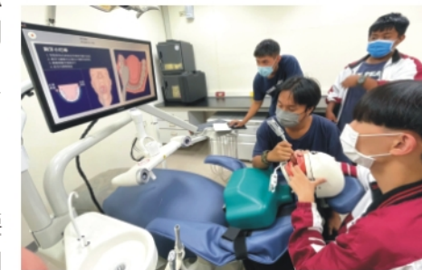
▲換個角度，可以清楚的看到口腔構造跟刷牙是否確實喔！