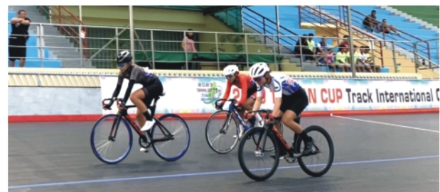
▲落後淘汰賽賽場實況