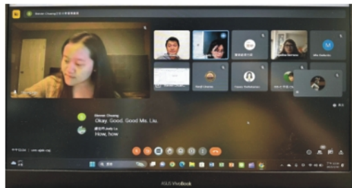
▲在計畫開始前，老師們就緊鑼密鼓的籌備了！