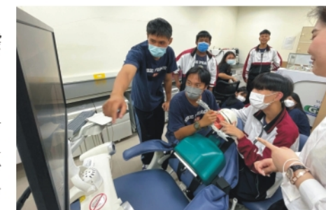
▲體驗VR口腔診療實作練習

從孩子們的笑容，的確可以感受到這是一場對孩子們來說別開生面的課程，更讓我們帶走這份感動跟能力！