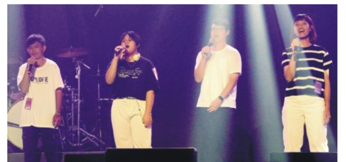
▲學校粉絲團還有精彩演出片段喔！ ( https://fb.watch/m-w6eayr9b/ )