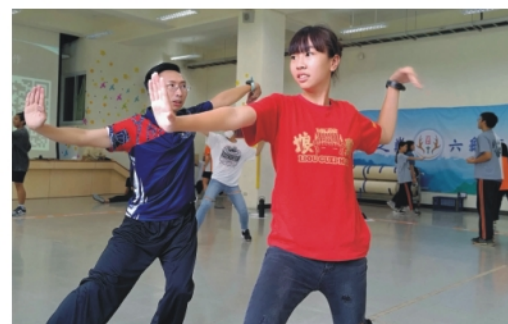
▲老師細心的指導同學肢體伸展的美感

學校在禮拜一(5/22)下午進行了一場別開生面的「國三-美感無界限-入班課程」，想到美感，大家想的可能是美術以及表演藝術。但這場研習讓我們打開眼界。其實美感是一種「質感」的選擇能力，人生中若能有美感相伴，一定可以活出獨特的自己跟色彩。何俊儀老師用「武術」帶領學生欣賞美感，更融合了資訊媒材及雙語教學讓所有同學都動起來，欲罷不能。「老師您有線上課程嗎？」結束後學生問，這應該是對老師的極高稱讚了吧！