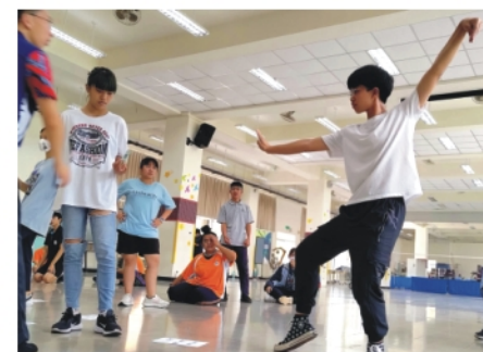
▲你還分得出來這是舞蹈還是武術嗎？