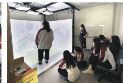
▲透過VR體驗在老舊公寓生活的樣貌