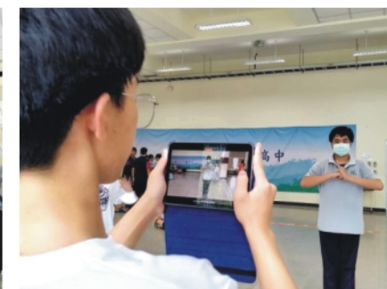
▲同學們現學現賣，馬上演示錄個小短片