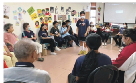
▲同學們分享自己的才藝與大朋友們同樂