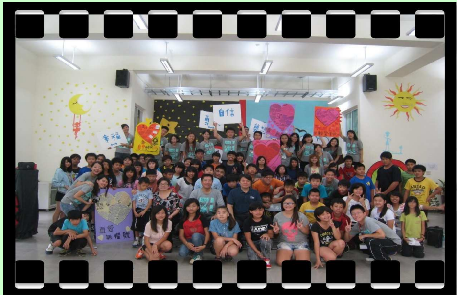
【上圖：政大學生與本校學生合影留念】

8/17 至 8/21 本校與國立政治大學真愛社辦理生命教育營隊，參加對象為國一與高一新生。這項活動的宗旨在於讓新生藉由活動培養自我探索、生涯思考及人際互動等能力，迎向新的學習階段。