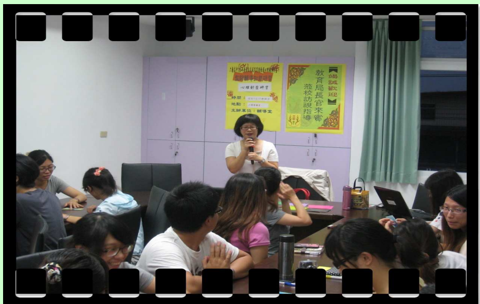
【上圖：研習會場實況】

教育工作是一份壓力沉重的職業，為了替勞苦功高的教師們舒壓，本校積極辦理教師輔導知能研習。這學期共舉辦了四場，主題分別為心理抒壓、導師知能、同理心訓練以及桌遊輔導。透過相關的研習課程，教師一方面獲得壓力抒發的機會，另一方面也提升了班級的輔導知能。