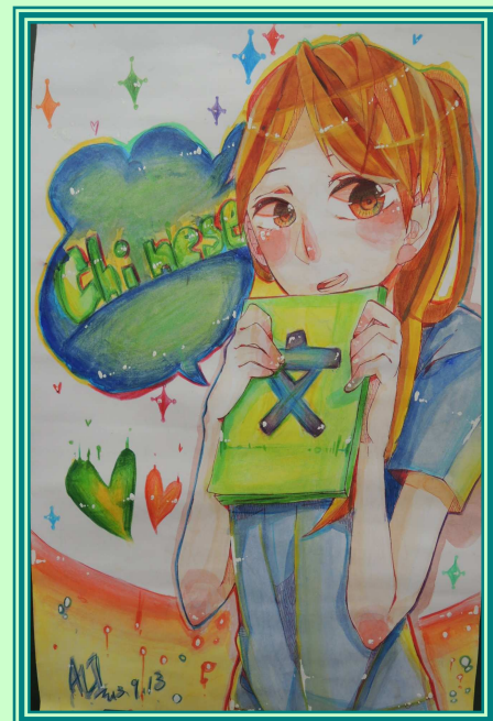
【右圖：教師肖像寫真比賽作品】

每到教師節，平時含蓄內斂的學生總會藉著這一天的節慶大方的向老師表達謝意與敬意。今年本校為了慶祝教師節，規畫一系列兼具趣味與教育意義的活動，包括「教師肖像寫真比賽」與「班級感恩卡製作」等，期望學生能從創作中理解尊師重道與感恩的深刻意涵。有些老師在看到自己畫像時都忍不住莞爾一笑，也有老師在看到感恩卡時熱淚盈眶。