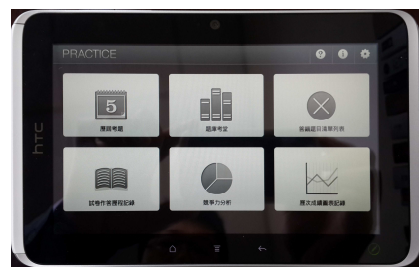
【上圖：HTC Flyer 平板電腦的頁面展示】

數位行動學習是未來雲端學習的趨勢，它是「以學習者為中心」的學習模式，透過高科技的網路平台，提供使用者一個分享資源與傳播知識的學習環境，使學習的形式打破時間與空間的限制，走到哪兒學到哪兒。本校高中部一年級新生是這次捐贈計畫的首批受惠者，每人均可獨立擁有一台 Flyer 平板電腦，作為課堂與課後的學習媒體