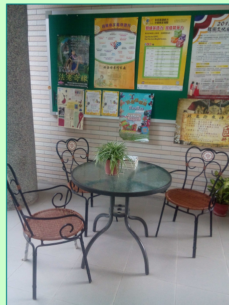
【上圖：高中部閱讀角實景】

為了提供師生與社區民眾一個隨性看書與舊書交流的場域，本分別在總務處及高中部大樓的二樓成立「閱讀角」。其硬體設備包括桌椅、報架與書架等，而陳列的圖書資源有二：一是圖書館過期的期刊雜誌與報紙，二是向校內師生與社區人士募集舊書。營運方式以自助的方式讓讀者自由選取書籍，讀者登記姓名與身份後即可帶回閱讀，不限歸還日期。閱讀角的成立不僅能使師生與社區的資源共享，達到節能減碳的環保效益，還能促進知識的交流，增進情誼的和諧。