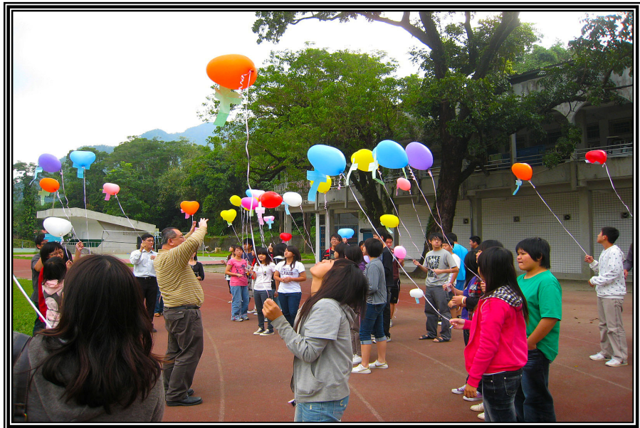
【上圖：繪本培力工作坊活動】