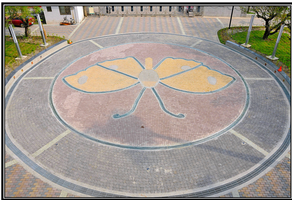
【上圖：本校前庭的紫蝶廣場】