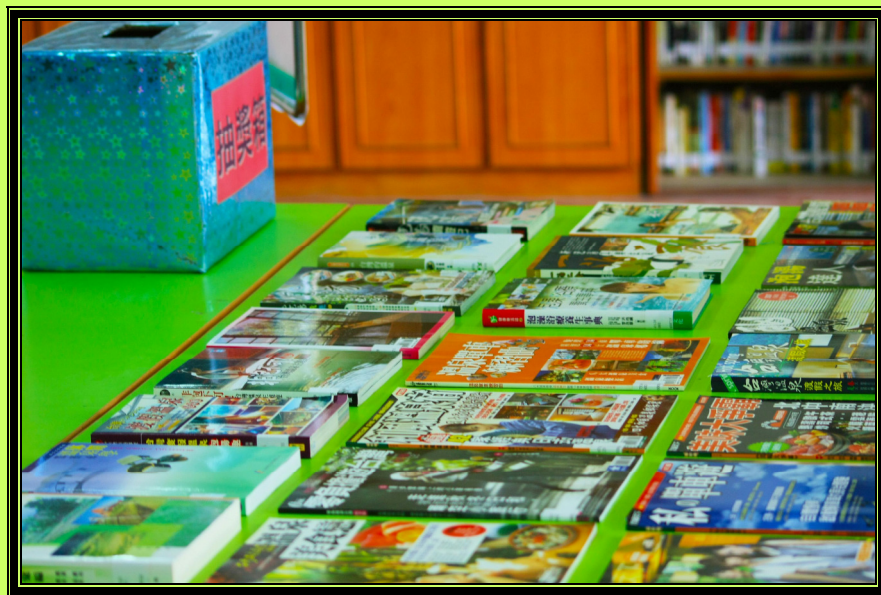
【上圖：「戀戀溫泉」主題書展會場】

為推廣閱讀風氣，並促進六龜地區的觀光產業，本校圖書館在 99 年 12 月舉辦「戀戀溫泉——再現六龜溫泉風華」主題書展，展出內容包括一般圖書、期刊雜誌、政府出版品、視聽資料等，多達數十種，讓校內師生及社區民眾瞭解溫泉的產生、類別、分布，以及衍生而出的溫泉文化。為振興六龜地區的溫泉風華，圖書館舉辦一場以「溫泉」為主題的書展，喚起大家對溫泉產業的關懷。為激發讀者參與的熱忱，同時還舉辦有獎徵答的抽獎活動，獎品有竹炭毛巾、溫泉粉等，讓參展的人有機會在寒風凜冽的冬季享受泡湯的樂趣。