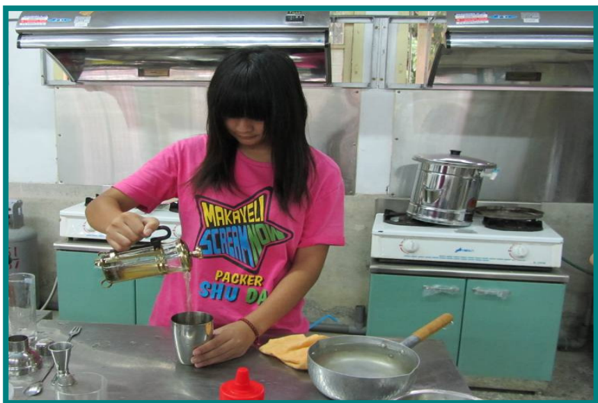
【圖二：電腦技能檢定班實況】